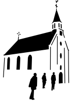
Protestantse Gemeente te Odijk